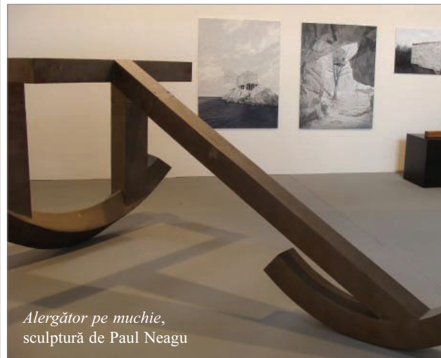
Alergător pe muchie , sculptură de Paul Neagu

O parte a proiectelor produse și curatariate de ICR în cadrul Olimpiadei Culturale au fost selectate ca urmare a unui concurs de proiecte, inițiat încă din luna aprilie a anului 2011, precizează ICR Londra.