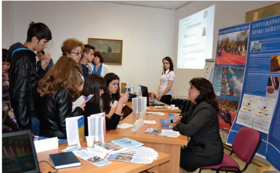
Reprezentanți ai Universității Spiru Haret s-au întâlnit cu liceenii interesați de ofertele educaționale universitare. Vizita acestora la standul nostru a fost nu doar un prilej de informare, ci și de dialog cu profesorii prezenți. Totul s-a desfășurat într-o atmosferă relaxată, plăcută, stimulativă.

Text: Corina GHIGA. Foto: Mihăiță ENACHE