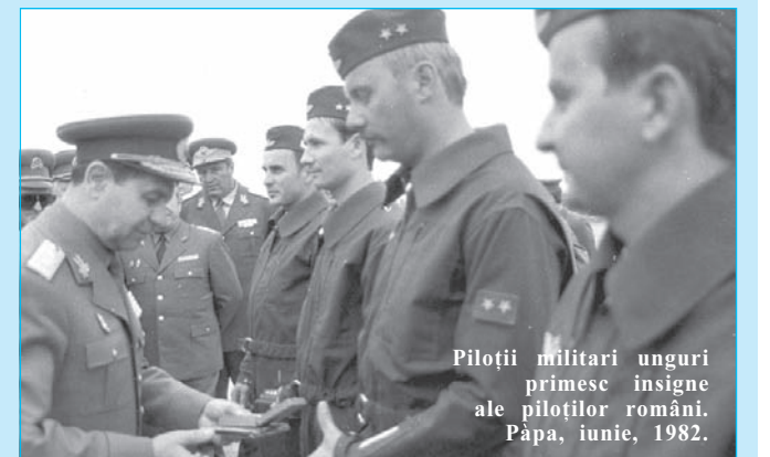
Piloții militari unguri primesc insigne ale piloților români. Papa, iunie, 1982.

în toate ocaziile de acest fel, atunci când era vorba de vizite la un asemenea nivel, șeful delegației a fost primit de Nicolae Ceaușescu, președintele României. La primire a participat și Jan Papp, ambasadorul Cehoslovaciei la București. În timpul întrevederii au fost subliniate bunele relații bilaterale, posibilitățile existente pentru dezvoltarea, în continuare, a acestora în plan politic, economic, tehnico-științific, cultural, militar, precum și în sfera vieții internaționale. În contextul internațional dat, comunicatul referitor la discuțiile avute sublinia că s-a reliefat necesitatea de a se acționa pentru oprirea cursului periculos al evenimentelor spre confruntare și război, pentru înfăptuirea dezarmării, în primul rând al dezarmării nucleare politicii de destindere, înțelegere, colaborare și pace pe continentul nostru și în întreaga lume.