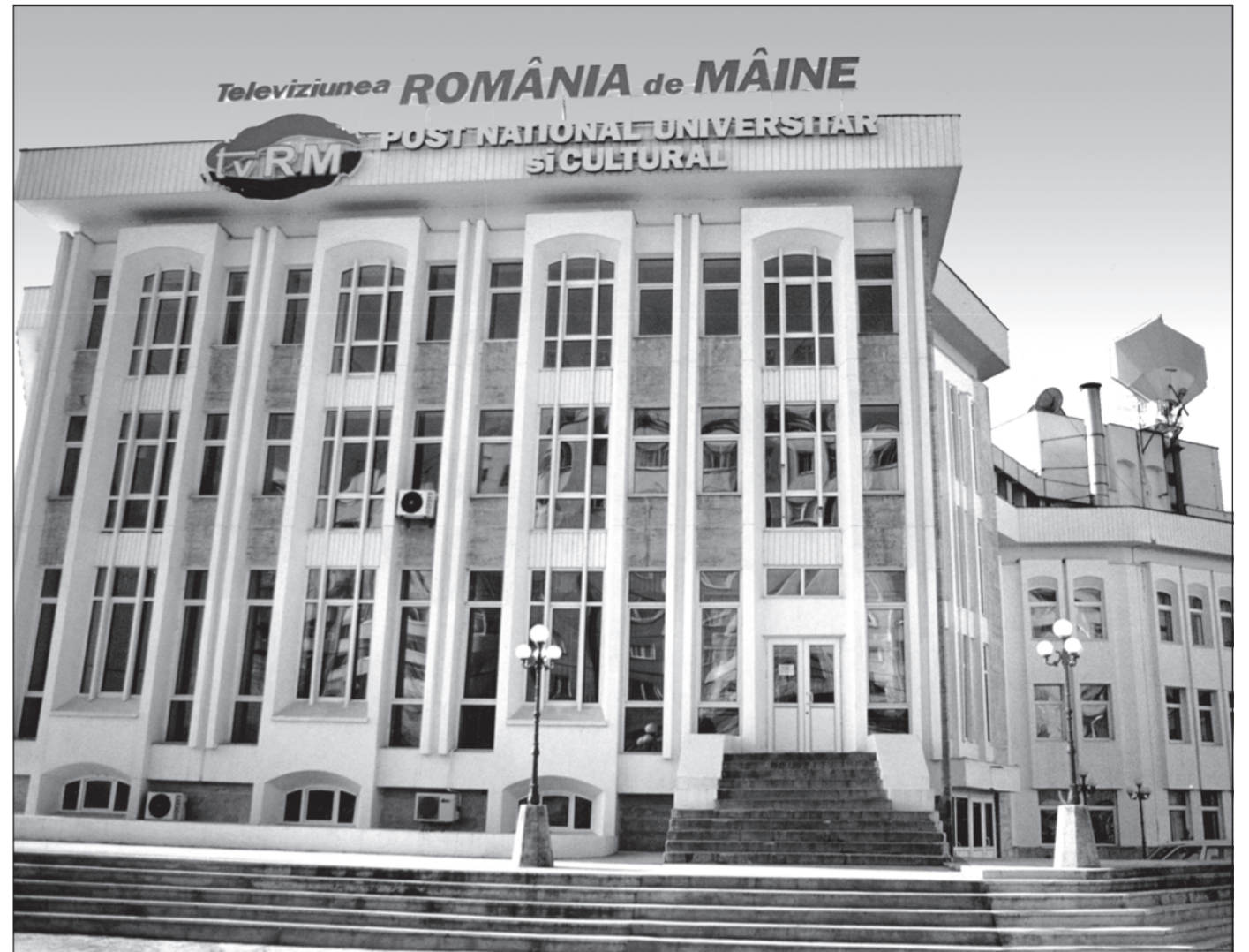
Șoseaua Berceni nr. 24