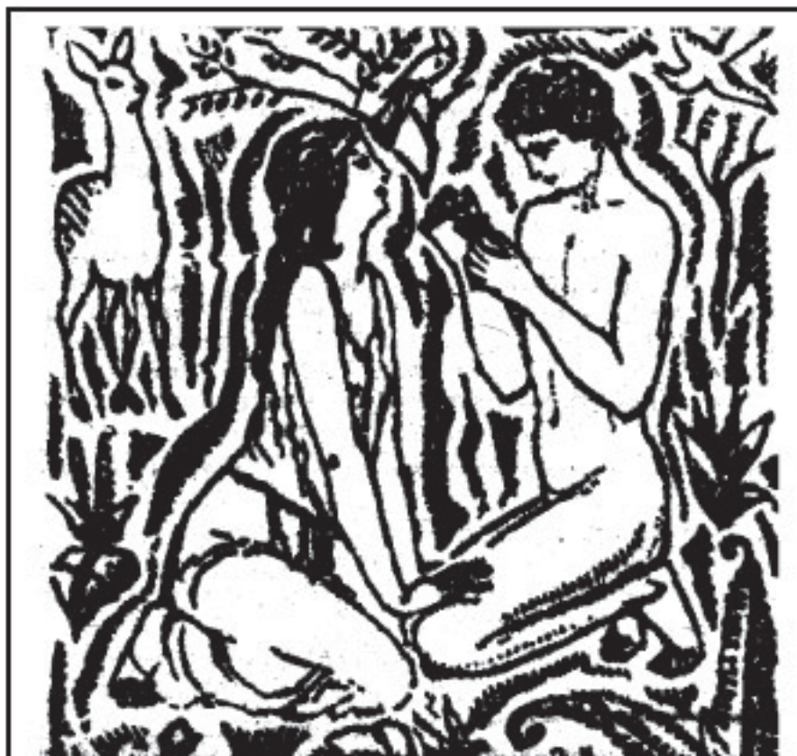
Ilustrație de Bordenache la poezia „Floare albastră”

... Mihai Eminescu a fost mintea cea mai autohtonă și, în același timp, cea mai universală care s-a născut vreodată pe pământul românesc. A avut norocul rar – norocul celor favoriți ai soartei – să trăiască în epoca în care națiunea română lupta pentru găsirea căii adevărate în vederea formării sale spirituale, și să-și asume răspunderile imense de dascăl, fără măcar ca poetul să fi tins spre asta. Personalitatea sa îmbrățișează întreaga această epocă, iar opera sa a devenit evanghelia spirituală a poporului său, continuând până astăzi să lumineze, să fie etalonul întregului tezaur moral, spiritual și național al românilor. Pentru că Mihai Eminescu, forța aceasta creatoare și îndrumătoare, nu a fost numai un poet genial, un cântăreț neîntrecut al iubirii, al vieții, al durerii, nu a fost numai un gânditor profund, Mihai Eminescu a fost meșterul inspirat care a îmbogățit limba română, a prelucrat-o poetic, și a mai fost înviorătorul sentimentului național al românilor, donatorul unei intelectualități naționale, autentice.