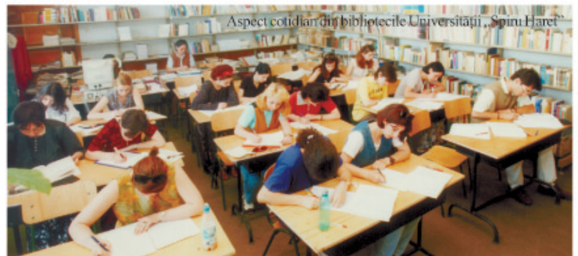
Aspect cotidian din bibliotecile Universității „Spiru Haret”

Următorul simpozion, programat pentru februarie 2001, este deschis oamenilor de știință și cultură din afara României care doresc să prezinte aspecte de interes românesc în știința și cultura altor țări. Studiile vor fi publicate în volumul următor de PROCEEDINGS. Comunicările se primesc pe adresa: G.C.S. Box 1364, New York NY 10163-1364, USA.