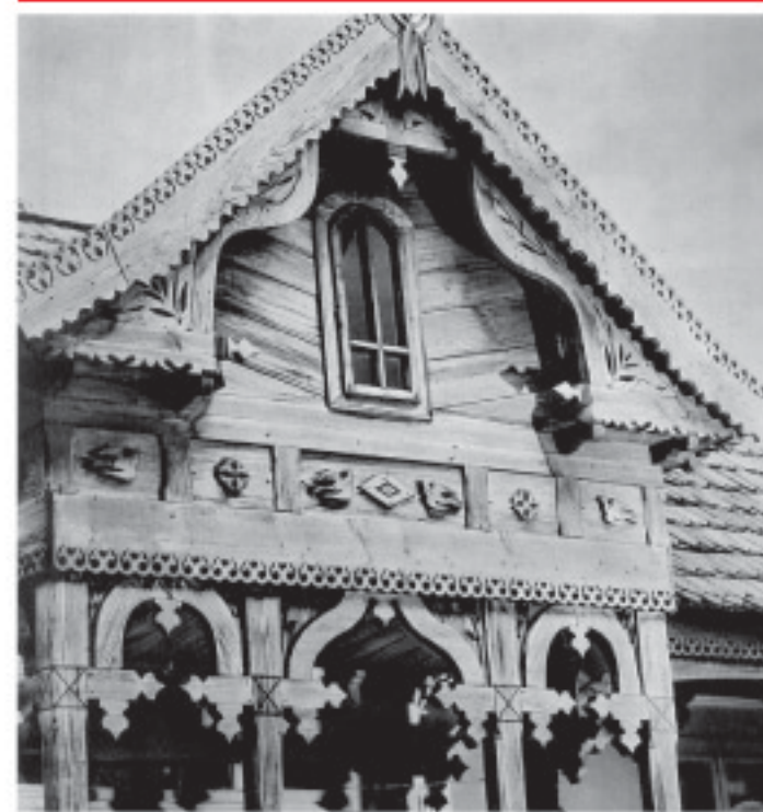
Detaliu de prispă – satul Urechești, Oltenia