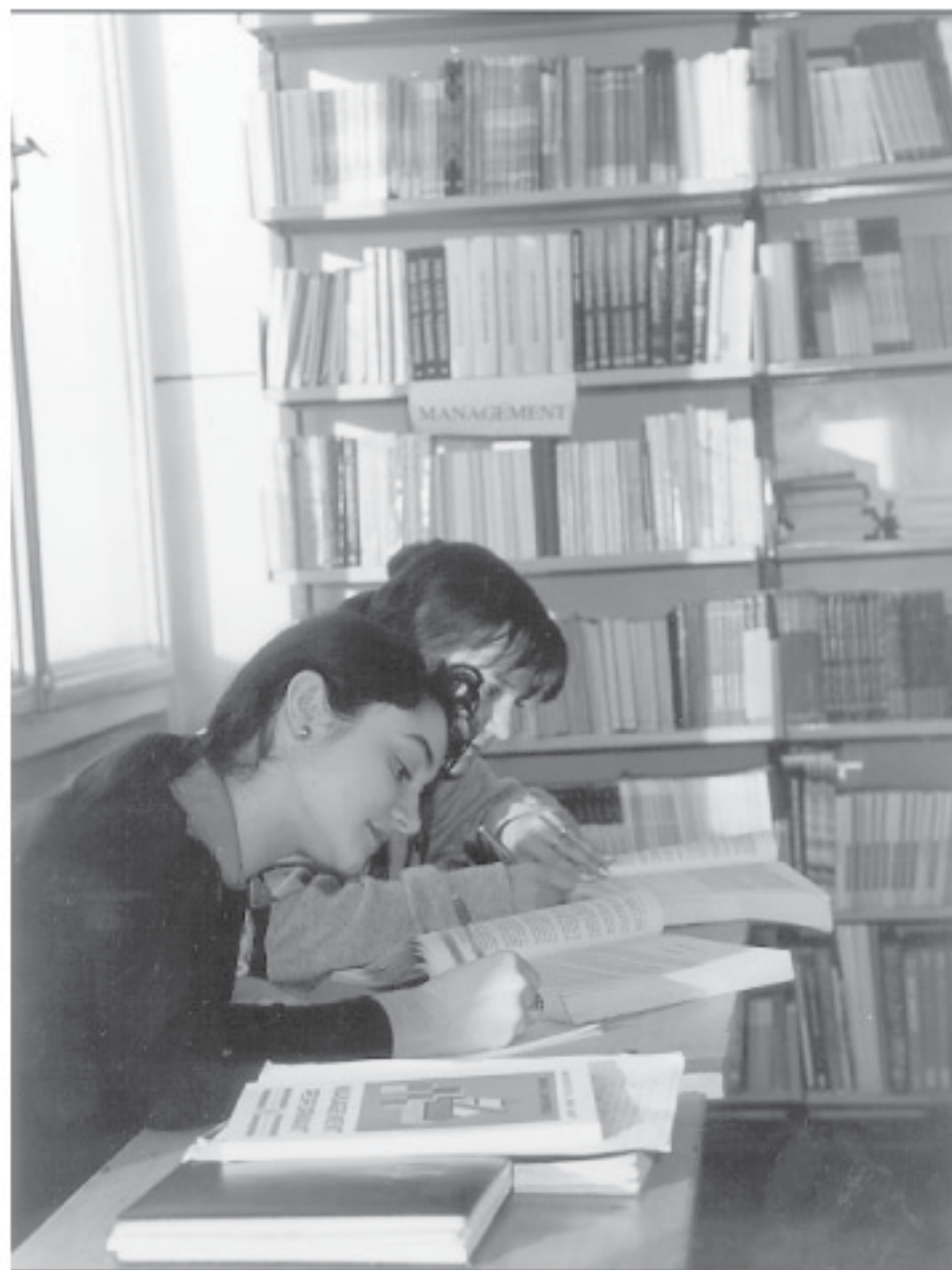
Studiu în bibliotecă la „Spiru Haret”

Prognozele pe anii 1999 și 2000 deocamdată nu sunt încurajatoare, dar aplicarea hotărâtă a unui pachet de măsuri economice care să fie emanația majorității clasei politice, ar putea conduce la o influență pozitivă a factorilor analizați mai sus, cu efect benefic asupra stabilizării cursului de schimb valutar, curs care este nu numai un barometru al stării economiei, dar și o pârghie a evoluției ei sănătoase.