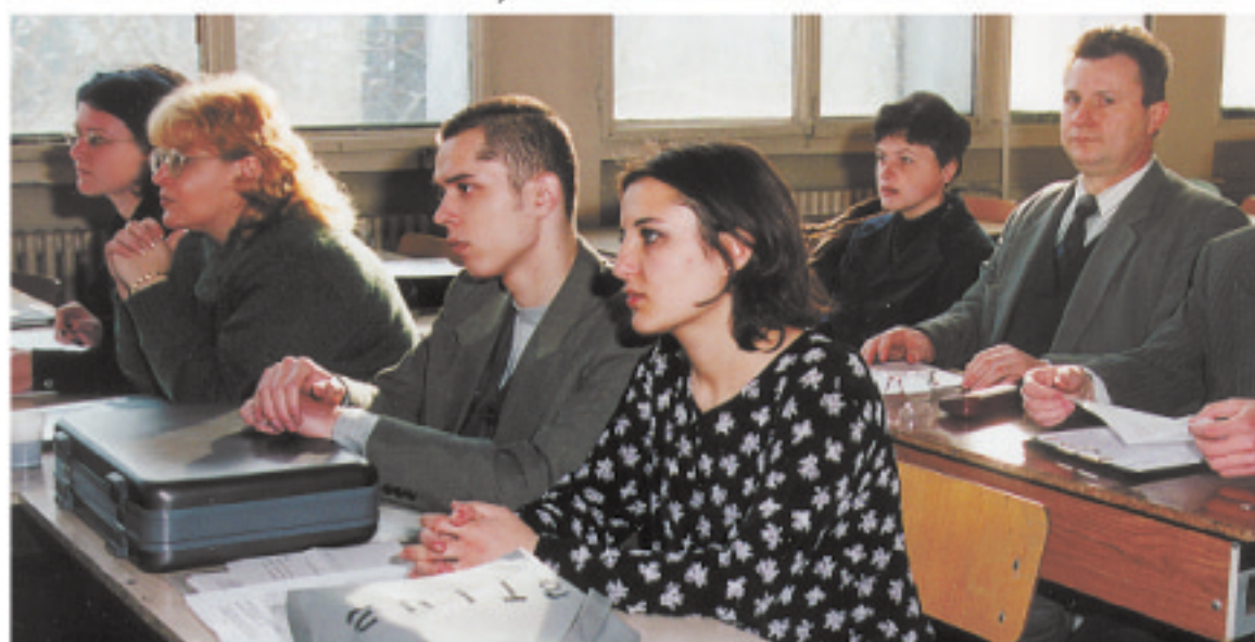
Sesiunea științifică a studenților Facultății de Sociologie-Psihologie